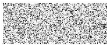
Dosedělová Anna tajemník TJ

TJ BŘIDLIČNÁ, z.s. U hřiště 424, 793 51 Břidličná IČ: 005 60 529 -3-