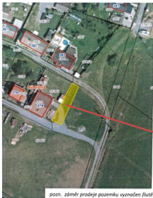
pozn. záměr prodeje pozemku vyznačen žlutě

pozemku parcelní číslo 1795/5 (orná půda) o výměře 170 m 2 v k. ú. a obci BŘIDLIČNÁ (nová parcela dle GP č. zak.:1411-5/2024) zřízení zahrady a příjezdu k RD