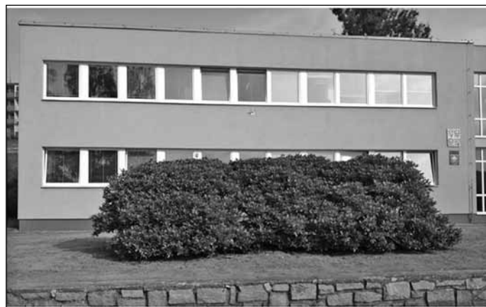
Studie návrhu řešení - plocha u městského úřadu, Etapa I