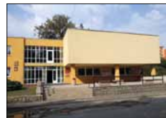
Pokračování na straně 2.