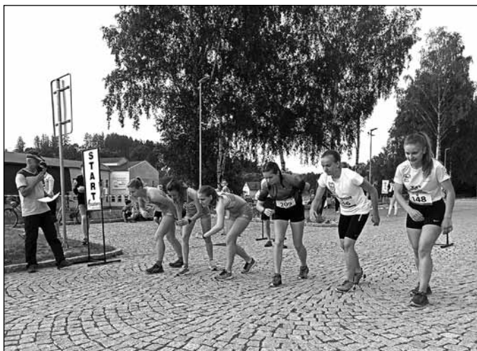
Kategorie dorostenky a juniorky, „Večerní běh 2020 Břidličná“.