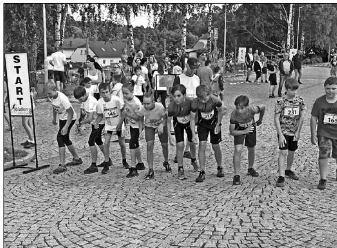
Kategorie mladší žáci, „Večerní běh Břidličná 2020“.